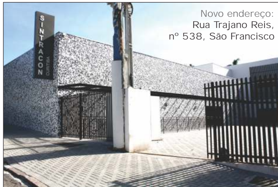
Novo endereço: Rua Trajano Reis, nº 538, São Francisco

A nova sede social está localizada nas antigas instalações da Faculdade ESEEI, no bairro São Francisco, que foi totalmente reformada e ampliada. O tamanho e a qualidade do local impressionam. O grande