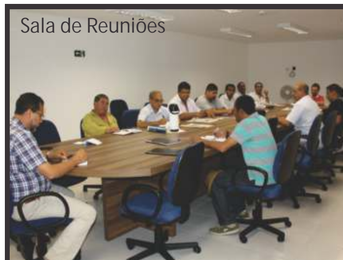
Sala de Reuniões

Agora a nova Sede Social está aberta a todos e os trabalhadores são bem-vindos para os atendimentos necessários. Se quiser só conhecê-la, venha tomar um cafezinho com a gente. As portas do Sindicato estão sempre abertas a todos os trabalhadores.