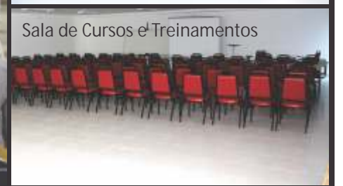
Sala de Cursos e Treinamentos